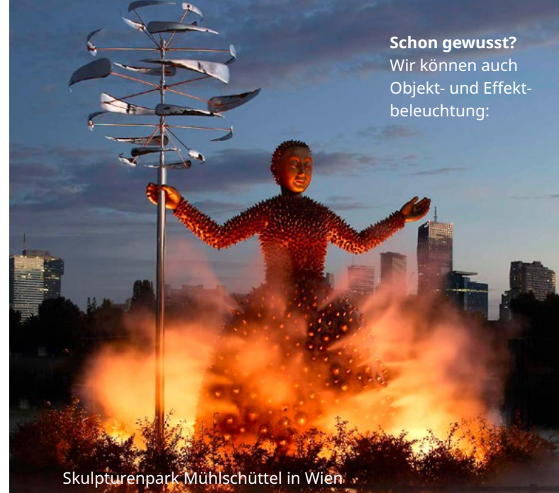
Skulpturenpark Mühlshüttel in Wien

Schon gewusst? Wir können auch Objekt- und Effekt- beleuchtung: