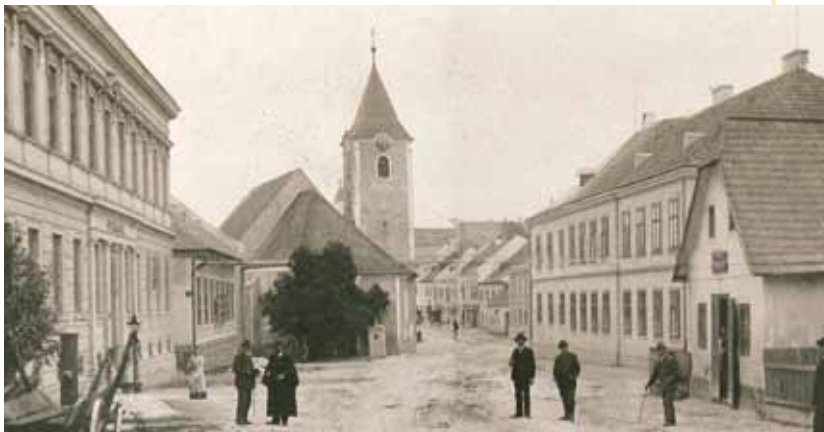
OSR Paul Lenauer präsentiert in seiner Chronik „Ottenschlag“ viele interessante Bilder, Geschichten, und Fakten der Vergangenheit – zum Beispiel Ottenschlags Marktplatz um 1900.

Im 352 Seiten starken Buch findet man unter anderem interessante Fakten, Geschichten und Bilder zum Ort und seinen Vereinen, zu den Schulen, der Bauernkammer, der Raiffeisenkasse, dem Bezirksgericht, dem Gendarmerieposten, der Landwirtschaft einst und jetzt sowie amüsante Begebenheiten aus dem Alltagsleben.