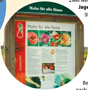
Einige Beispiele für die Kooperation waltergrafik und Beschriftungszentrum Jäger.