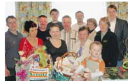
Große Freude herrschte bei den Gewinnern der vielen Preise des Gewinnspiels.

Am 24. und 25. April 2010 veranstalteten 9 Betriebe der Marktgemeinde Kottes-Purk „Tage der offenen Tür“. An beiden Tagen wurden die ausstellenden Gewerbebetriebe von der riesigen Besuchermenge überrascht. Das vielfältige und bunte Angebot der verschiedenen Unternehmen zog Interessenten aus nah und fern nach Kottes. An beiden Tagen wurden jeweils um 17 Uhr tolle Preise verlost. Die jeweils 20 Gewinner wurden sofort verständigt und die Preise persönlich übergeben. Auch für das nächste Jahr ist wieder eine derartige Veranstaltung geplant. Die Gewerbebetriebe aus Kottes-Purk freuen sich schon jetzt wieder auf ihren Besuch.