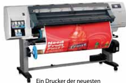
Ein Drucker der neuesten Generation – auf Latex-Basis – gewährleistet beste Qualität im Beschriftungszentrum Jäger.

Latexdruckers erworben. Diese umweltfreundliche Druckmaschine garantiert noch kürzere Produktionszeiten und ein noch feineres Druckbild. Einige Beispiele der gemeinsamen Zusammenarbeit sind die Schau tafeln am Mohnlehrpfad in Armschlag, am Walpurgisweg in Grafenschlag, bei der Wald-WunderWelt in Sallingberg, die Regionsübersichtstafeln in Ottensschlag und Traunstein, Bautafeln für Schiller Bau, die Autobeschriftungen für Waldviertler Viktualien, für Orthopädie Stefanie Kroihns oder jene für die Tischlerei Hobl aus Martinsberg um nur einige zu nennen.