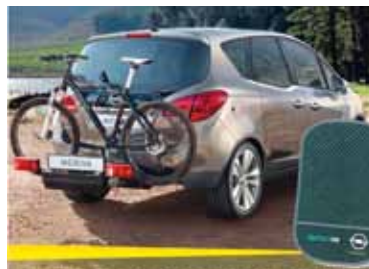
Macht alles mit. Der neue Opel Meriva.

Geburtstag feiert Suzuki jetzt gleich doppelt. 100 Jahre Suzuki und 30 Jahre Allradinnovation in Österreich. Und das Beste: Die Geschenke bekommen Sie! Freuen Sie sich auf drei Sondermodelle mit jeweils 30% mehr an Extras zum sensationell günstigen Preis!