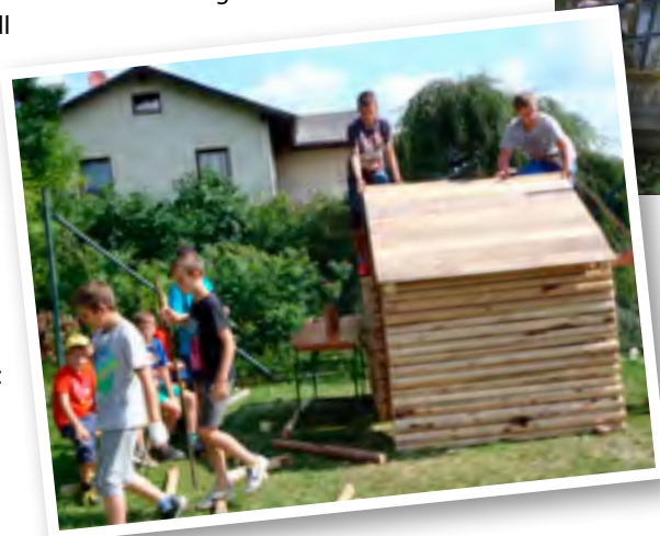
In Kottes entstand diese tolle Hütte

Weitere Informationen: www.waldviertler-kernland.at