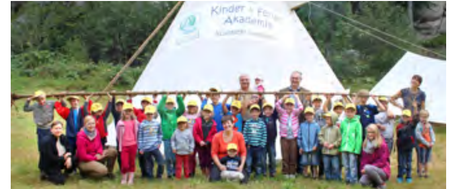
„Wildnis Wissen“ war das Thema bei der Kinder & Ferien Akademie in Schönbach

Weitere Fotos zur Kinder & Ferien Akademie finden Sie unter www.waldviertler-kernland.at/akademie