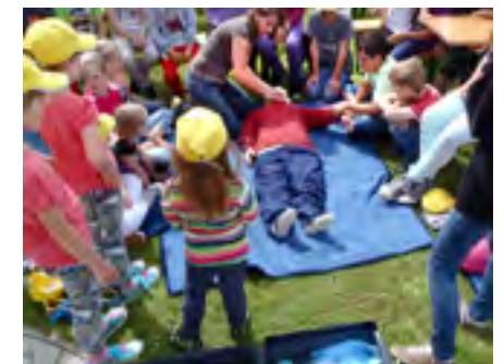
Sanitätercamps in Martinsberg und Großgöttfritz