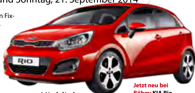
Jetzt neu bei Böhm: KIA Rio

„Bei der Herbstausstellung beim Böhm“ – für manche schon ein Fixtermin im Veranstaltungskalender – gibt es die neuesten Automodelle zu bewundern, Probefahrten werden organisiert und es gibt Gutes für den Gaumen. Heuer packen wir noch etwas besonderes drauf: KIA, die neue Marke im Bezirk Zwettl. Im Messezeitraum haben wir speziell für diese Marke besondere Angebote.