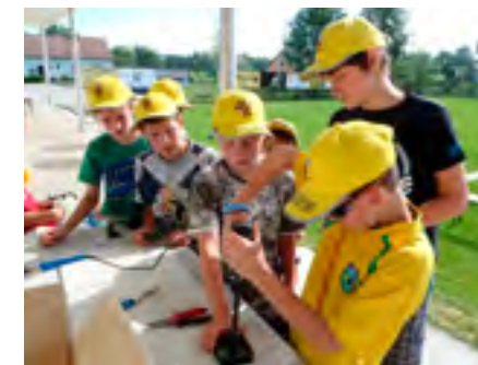
In Kirchschlag und Grafenschlag ging es zum Thema „Strom erzeugen“ zur Sache.