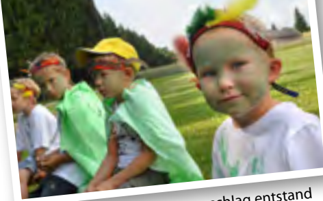
In Ottenschlag entstand ein kreatives Umwelt-Musical