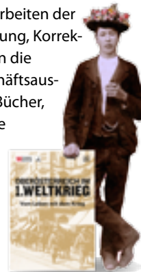
Ausstellung für das OÖ. Landesmuseum

Unsere Profession ist die Gestaltung von Kommunikationsmedien. Im Büro in Langschlag erfolgen die Arbeiten der Druckvorstufe (Gestaltung, Satz, Bildaufbereitung, Korrekturen, Druckaufbereitung und Datentransfer an die Produktionsfirmen). Dazu zählen Logos, Geschäftsaussstattungen, Schilder, Etiketten, Zeitschriften, Bücher, Plakate, Prospekte, Flyer, Fahnen, Transparente und natürlich individuelle Websites. Zu einem Schwerpunkt der letzten Jahre hat sich die Gestaltung von Lehrpfaden, Ausstellungen und Museen entwickelt. So durften wir heuer z.B. die Sonderausstellung „Oberösterreich im 1. Weltkrieg“ für das Landesmuseum in Linz grafisch gestalten.