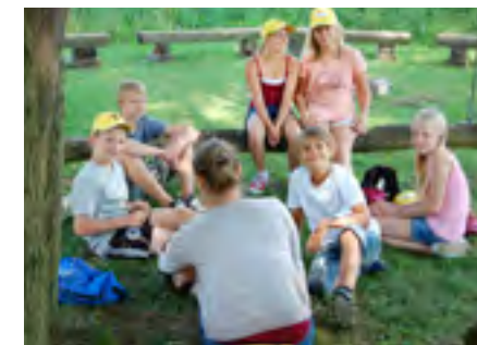
In Albrechtsberg hieß es „english and nature“