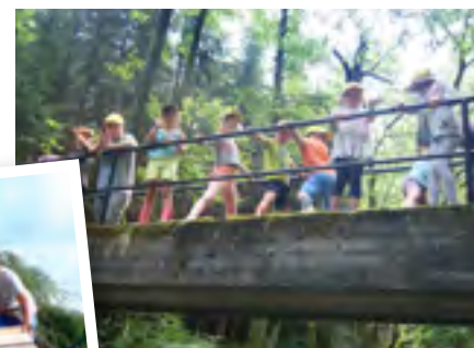
Auch in Waldhausen (Foto) und Bad Traunstein widmete man sich dem „Leben in der Natur“