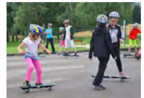
Sportlich ging es in Sallingberg zu