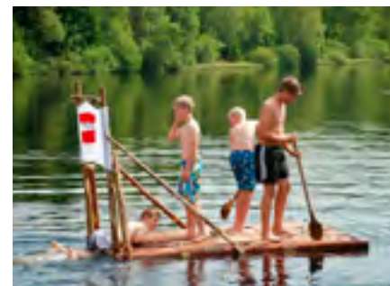
Impressionen aus Bärnkopf