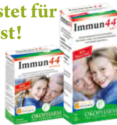
Immun 44® Kapseln und Soft Nahrungsergänzungsmittel mit Phytoextrakten

Wir führen für Sie in der Apotheke ein breit gefächertes Angebot an Präparaten, mit deren Hilfe Sie der kommenden Jahreszeit gelassen entgegensehen können. Das Team der Schlossapotheke Ottenschlag wird Sie dazu gerne und kompetent beraten!